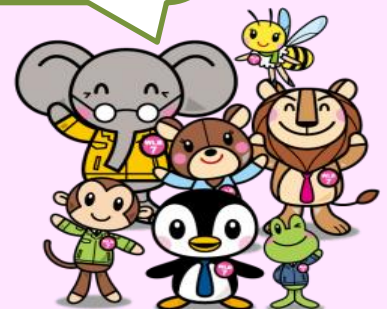
ひょうご仕事と生活センター キャラクター「WLB7」