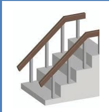
託児スペース整備 手すりの設置等